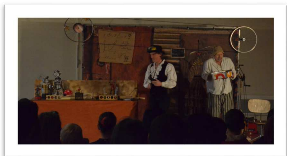
Spectacle de Noël

Un forage d'eau potable a été réalisé par le SIAEP sur notre terrain communal pour venir en complément du forage existant situé au lac. Cet ouvrage devrait être mis en service très prochainement.