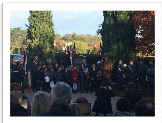
Cérémonie 2019 du 11 novembre 1918