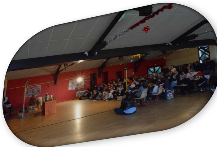
Arbre de Noël 2018