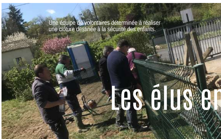
Une équipe de volontaires déterminée à réaliser une clôture destinée à la sécurité des enfants.