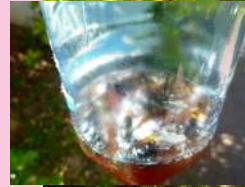
Piège mortel pour les femelles frelons affamées en ce début de printemps.