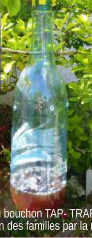
Simplicité du bouchon TAP-TRAP mis à la disposition des familles par la mairie.

Redoutables les pièges à frelons distribués à chaque famille par la municipalité ! Mais aussi ceux mis en place il y a quelques jours, tout autour du lac, par nos élus.