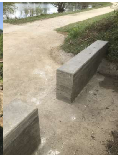
Ci-dessus, une belle fondation maçonnée réalisée pour accueillir le futur dispositif de la vanne du déversoir.