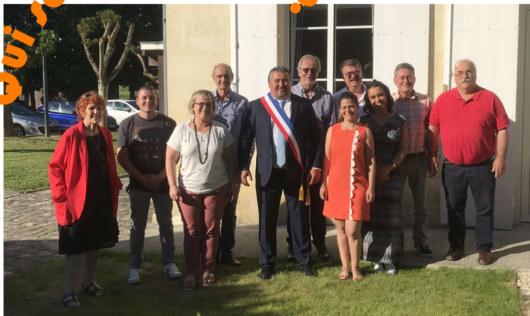
Le conseil municipal au grand complet, de gauche à droite :